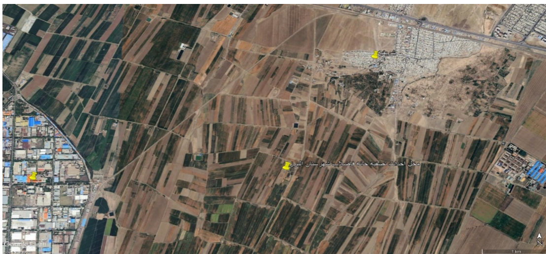
شکل شماره (۱) : موقعیت زمین تصفیه خانه نسبت به شهرهای شریف آباد و الوند